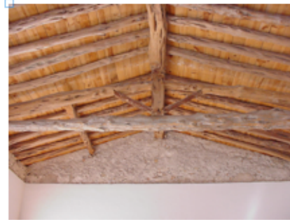
BIGUES i JÀSSERES