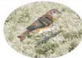
TORD - LLENTISCLE I OLIVÓ